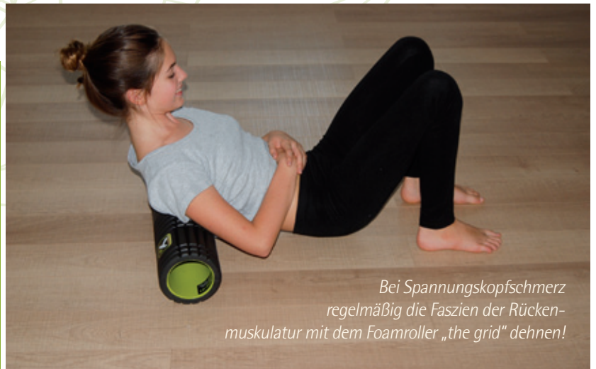
Bei Spannungskopfschmerz regelmäßig die Faszien der Rückenmuskulatur mit dem Foamroller „the grid“ dehnen!

> Wer nicht gezielt seine Faszien (Muskelhüllen) dehnt und damit lockert, eine bessere Durchblutung und Sauerstoffversorgung angespannter Muskelpartien erwirkt sowie Verklebungen löst, hat als Folge davon häufiger Kopfschmerzen als andere. Daher ist der Foamroller „the grid“ eine gute Unterstützung. Sportler schwören auf dieses einfache, aber wirkungsvolle Trainingsgerät, das ebenso für alle jene geeignet ist, die viel sitzen, Haltungsschäden haben oder mit anderen einseitigen Belastungen zu kämpfen haben.